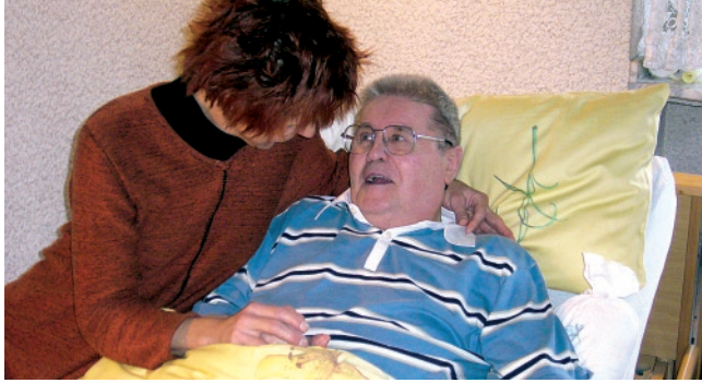
„Lasst mich doch zu Hause sterben.“